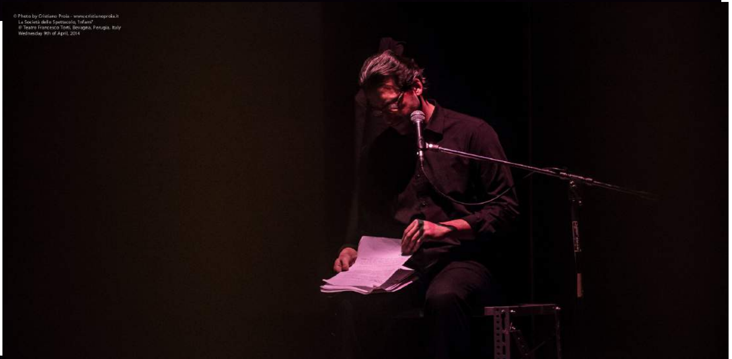
La Società dello Spettacolo, "Infami" © Teatro Francesco Torri, Bovagna, Perugia, Italy Wednesday 9th of April, 2014