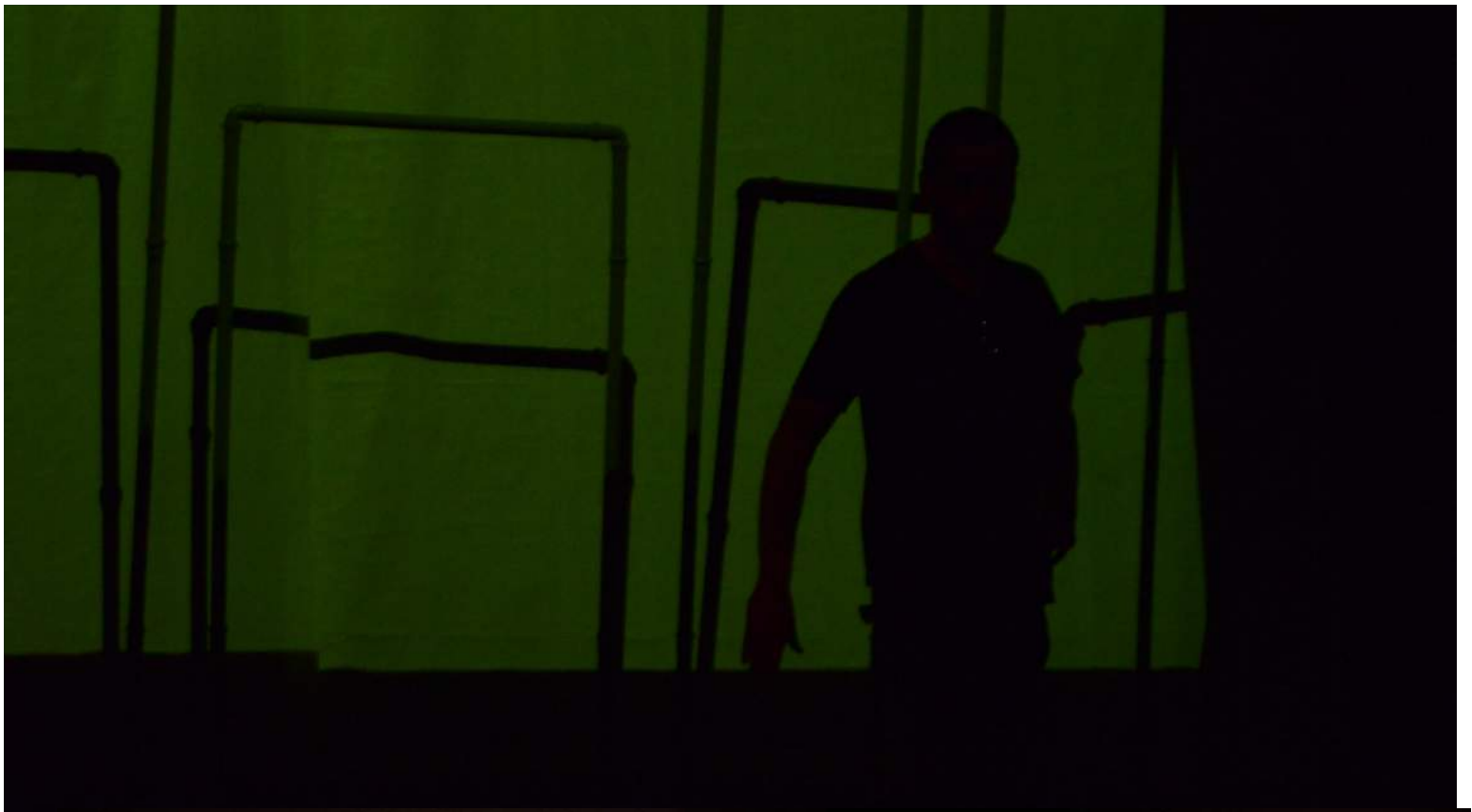
© Photo by Cristiano Proia - www.cristianoproia.it La Società dello Spettacolo, "Infami" © Teatro Francesco Torri, Bovagna, Perugia, Italy Wednesday 9th of April, 2014